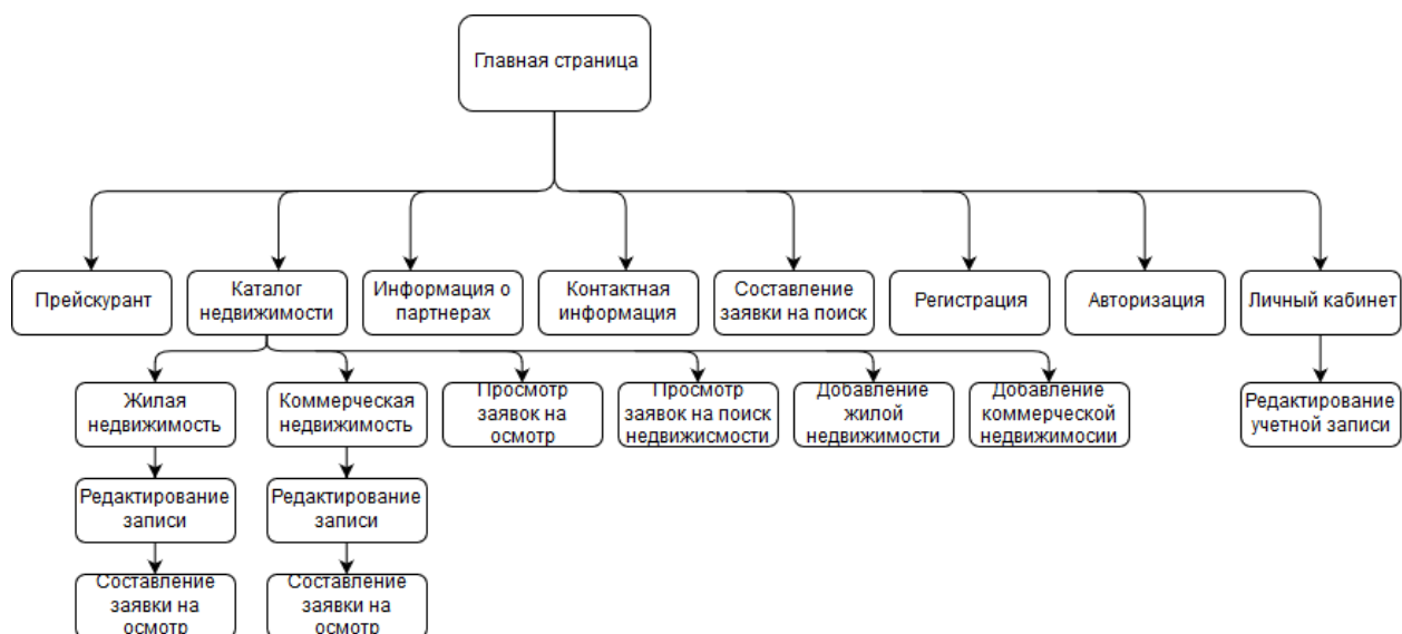
Рис. 2. Концептуальная структура веб-сайта

Так как с нашей системой будет работать два вида пользователей - администратор и клиент, то необходимо разграничить доступ к данным и функционалу системы для разных типов пользователей. Для этого необходимо расписать систему прав.